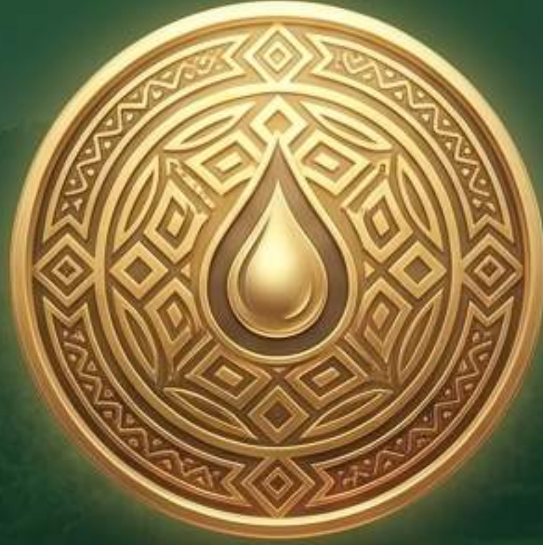
निर्मल ग्राम पुरस्कार

जिथे ग्रामपंचायत जबाबदार, तिथे गाव प्रगतिशील.