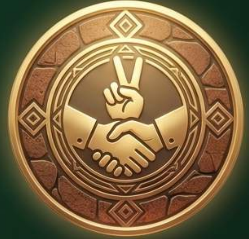
तंटामुक्त गाव पुरस्कार

ग्रामस्थांच्या सहकार्यामुळे आणि सक्रिय सहभागामुळे प्राप्त झालेले मानांकन.