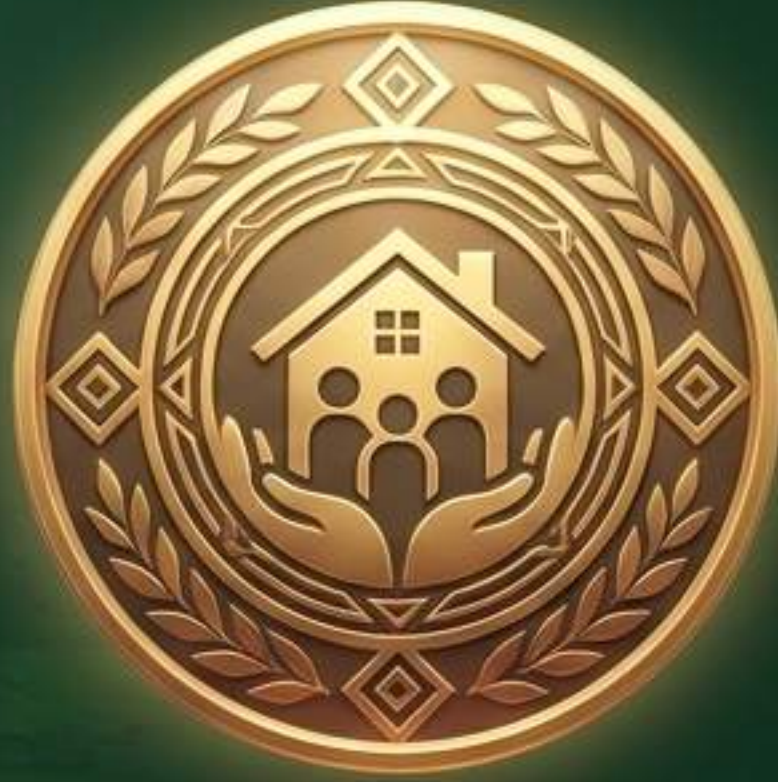
लोकराज्य गाव पुरस्कार